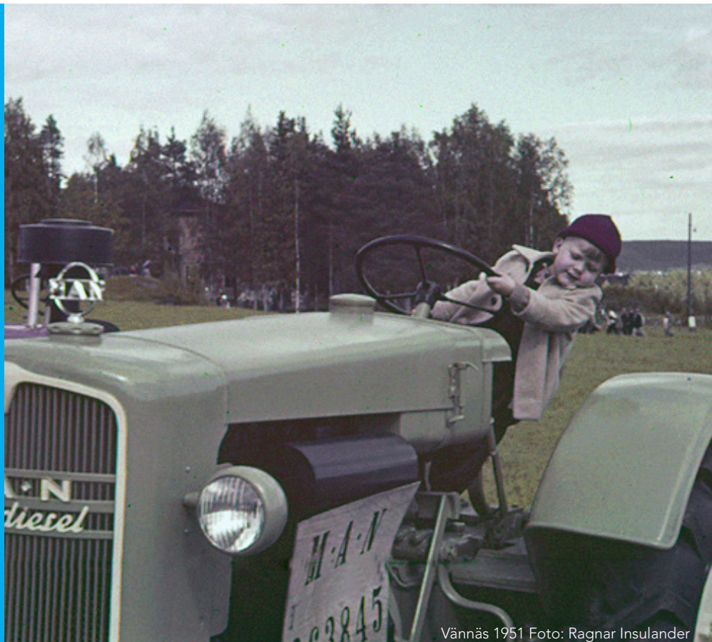
Vännäs 1951

Alla som bor i Västerbottens län har rätt till sitt kulturarv. Skogsmuseet i Lycksele, Skellefteå museum och Västerbottens museum vill genom "Alla tiders Västerbotten" bidra till att tillgängliggöra kulturarvet på olika sätt. Tillsammans med kommunbiblioteket, studieförbund och föreningsliv genomför vi program och aktiviteter.